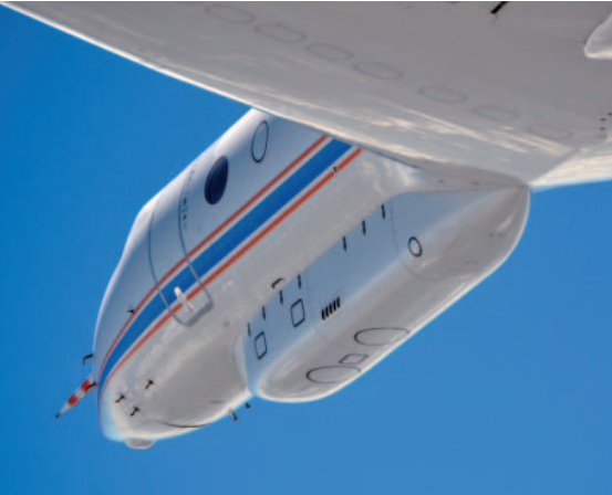
Im sogenannten Belly Pod ist Platz für wissenschaftliche Instrumente